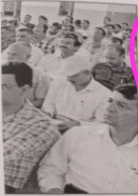
॥ में उपस्थित प्रतिभागी। संवाद