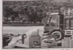
ढालपुर मैदान में झूले लगाने के